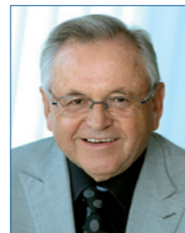
Wiestaw Kramski Kramski GmbH