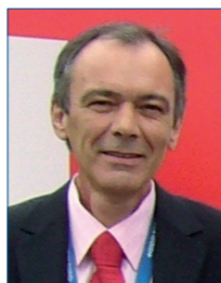
Dettlev Dierkes Heidelberger Druck- maschinen AG