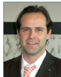
Patrick Seitz aluplast GmbH